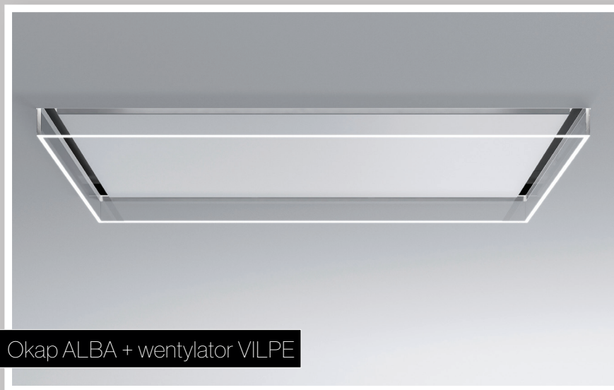
Okap ALBA + wentylator VILPE