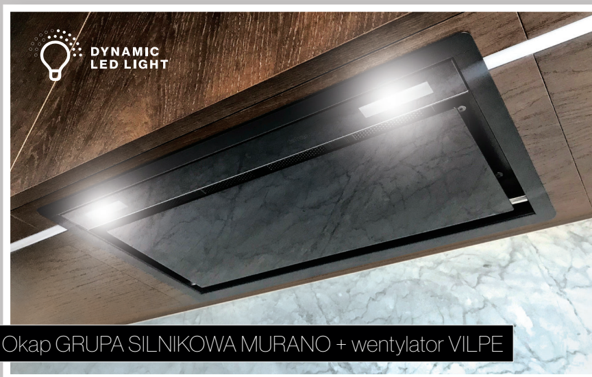
Okap GRUPA SILNIKOWA MURANO + wentylator VILPE

Gama kolorystyczna okapów: biały, czarny.