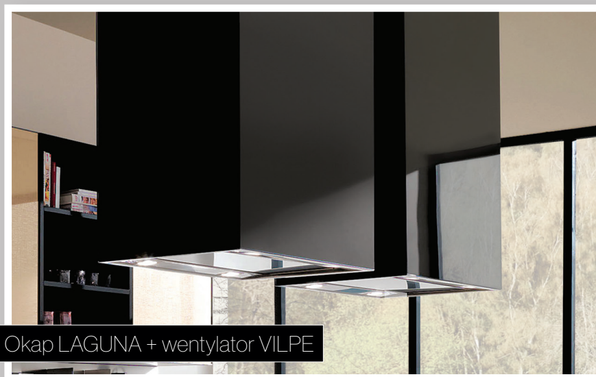
Okap LAGUNA + wentylator VILPE

Gama kolorystyczna okapów: biały, czarny.