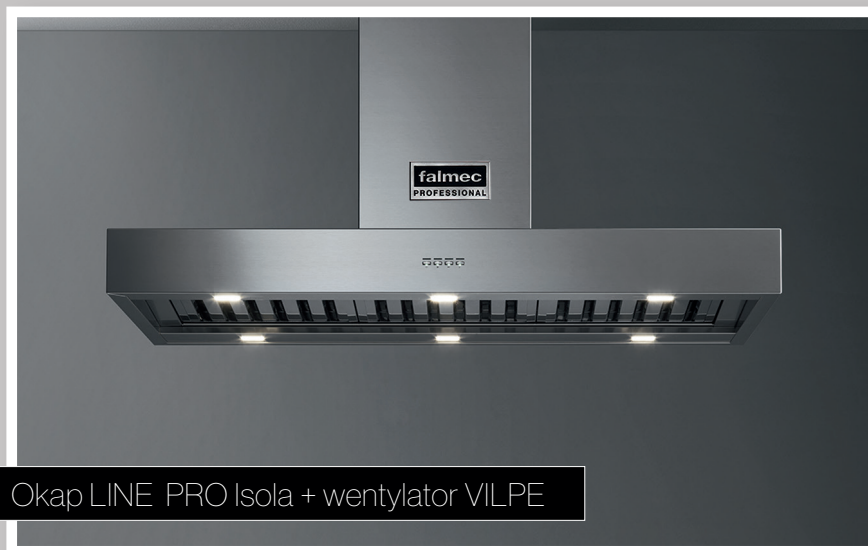
Okap LINE PRO Isola + wentylator VILPE