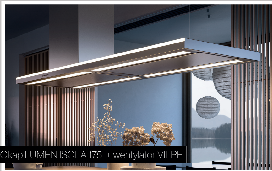
Okap LUMEN ISOLA 175 + wentylator VILPE