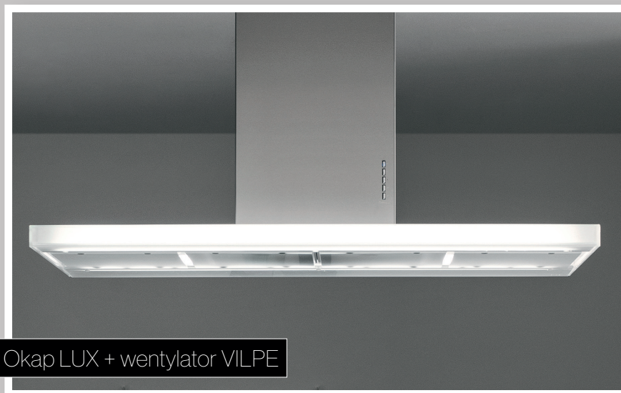
Okap LUX + wentylator VILPE