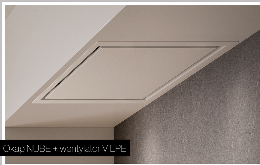
Okap NUBE + wentylator VILPE