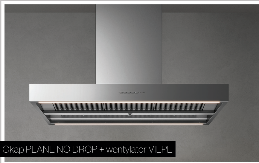
Okap PLANE NO DROP + wentylator VILPE