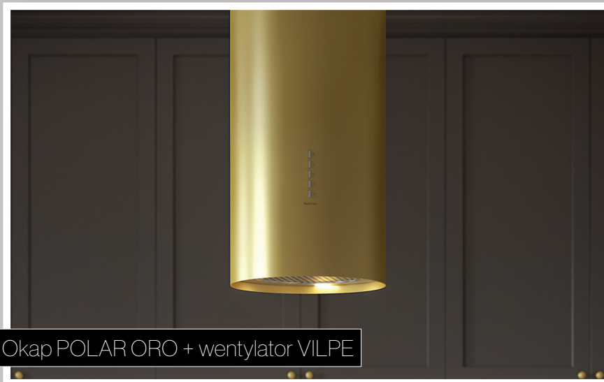
Okap POLAR ORO + wentylator VILPE