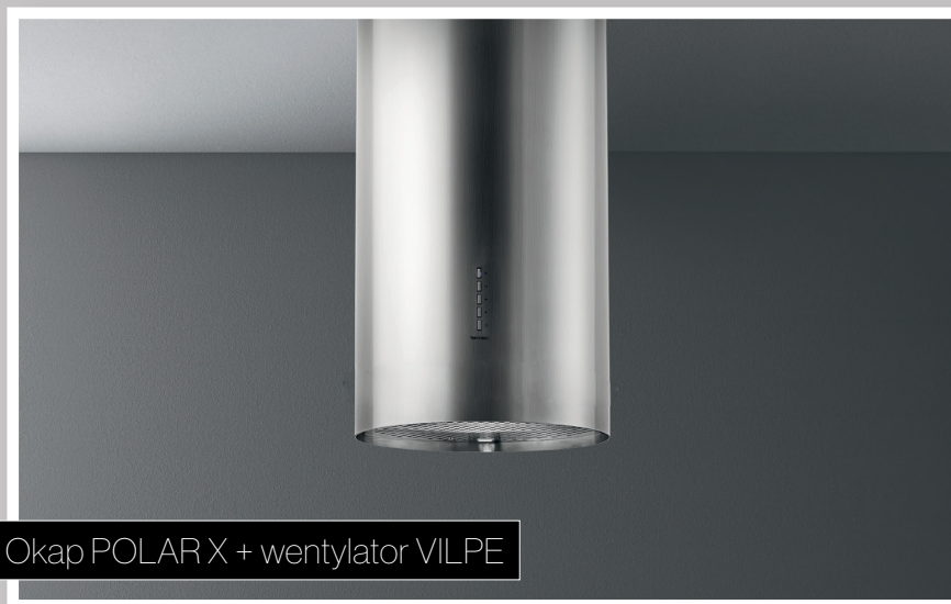
Okap POLAR X + wentylator VILPE