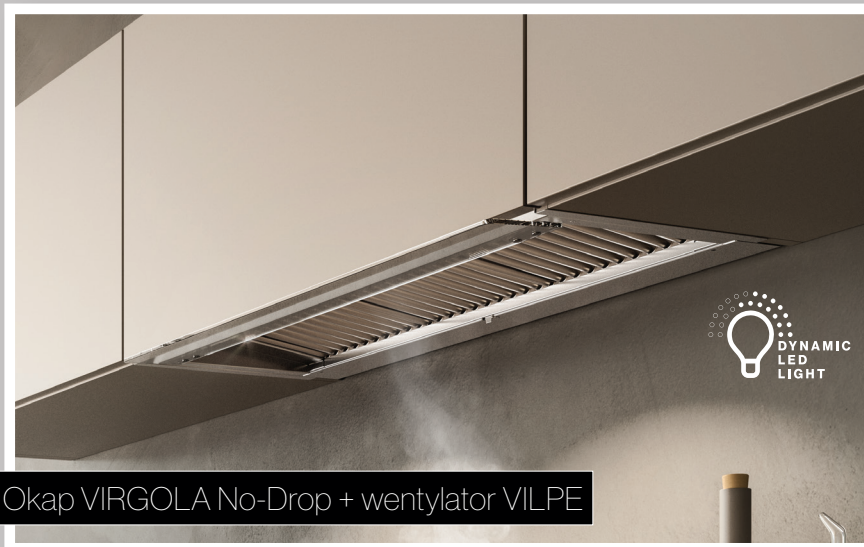
Okap VIRGOLA No-Drop + wentylator VILPE

Gama kolorystyczna okapów: inox, czarny.