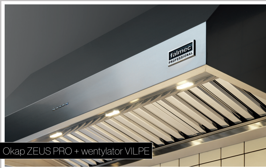
Okap ZEUS PRO + wentylator VILPE